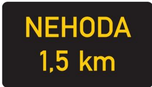
I 1 Nápisy