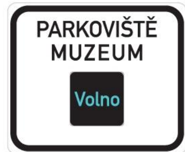
I 2 Obsaditelnost parkoviště